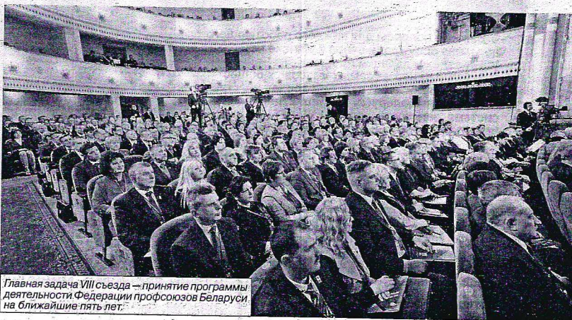
Главная задача VIII съезда — принятие программы деятельности Федерации профсоюзов Беларуси на ближайшие пять лет.

«Не хотелось бы приходить к этой жесткости. В противном