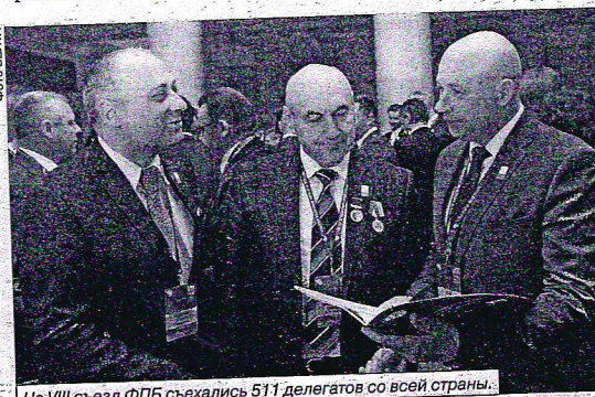
На VIII съезд ФПБ съехались 511 делегатов со всей страны.

— Что имеем сейчас? Общие показатели вроде бы неплохие. Что касается продуктов питания, настаивают на том, что уже в январе текущего года цены выросли больше чем на 1 процент. Также практически на протяжении года постоянно дорожает молочная продукция. Идиотизм полный.